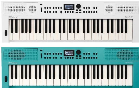
『GO:KEYS 5』（ホワイト） 『GO:KEYS 3』（ターコイズ）

ローランド株式会社は、本格的で多彩なサウンド、自由度の高い自動伴奏などのさまざまな機能を備えながら、楽器初心者でも演奏から楽曲作りまで気軽に楽しめるスタイリッシュなポータブルキーボード『GO:KEYS 5』『GO:KEYS 3』を2024年4月26日（金）に発売します。