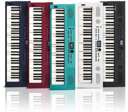
右から『GO:KEYS 5』グラファイト、ホワイト 『GO:KEYS 3』ターコイズ、ダークレッド、ミッドナイトブルー

デザインの面では、シンプルで直感的な操作パネルで、楽器初心者の方でも、気軽に演奏や楽曲作りを楽しめます。また、本体は持ち運びしやすいコンパクトなサイズ。複数のカラー・バリエーションを取り揃え、好みの一台が見つかります。