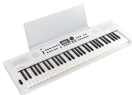
専用譜面立て「MRGKS3/5」を取り付けた 『GO:KEYS 5』ホワイト