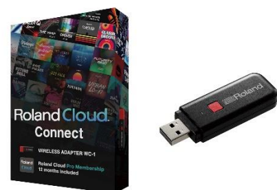
「Roland Cloud Connect」

また、USB オーディオ/MIDI 機能を備え、PC とケーブルで接続して音楽制作ソフトとの連携が可能。Bluetooth® オーディオ/MIDI 機能でスマートフォンやタブレットとの接続もでき、好みの曲を流しながら演奏したり、アプリでの楽曲制作を楽しめます。さらに、外部マイクの接続が可能な『GO:KEYS 5』では、マイクエフェクトとともに弾き語りを楽しめます。