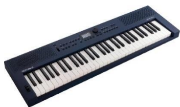
『GO:KEYS 3』ミッドナイトブルー