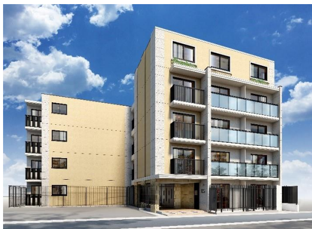
※ 「EL FARO(エルファーロ)」シリーズ