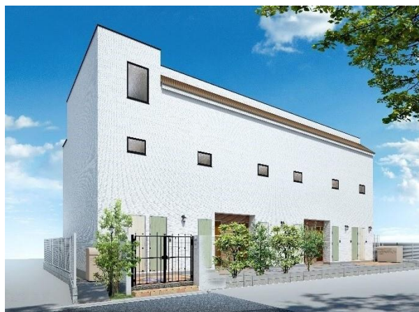
※ 「MIJAS (ミハス)」シリーズ