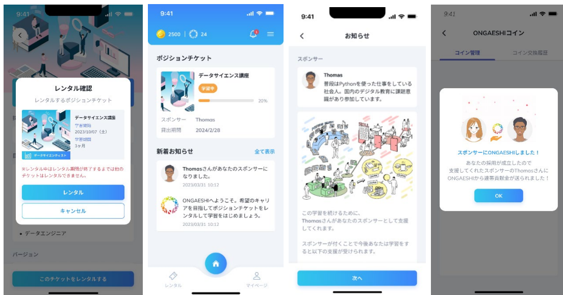
左3枚：スポンサーからポジションチケットを借りることで無償で学べる