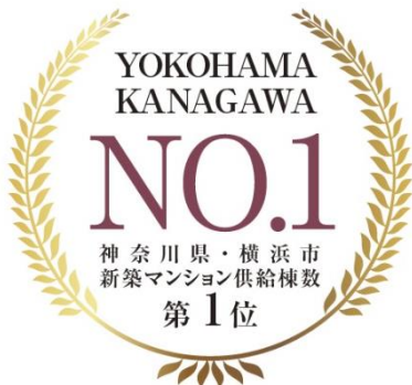
■横浜市ランキング

当社は利便性の高い立地にこだわり、その街の風景やライフスタイルにふさわしいマンションをご提供し、なかでも神奈川県と横浜市エリアにおいては、新築マンション供給棟数 NO.1 の実績（※1）を積み重ねています。