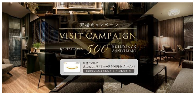
新規ご来場キャンペーン

https://www.meiwajisyo.co.jp/cliocp/kanagawa500resident/