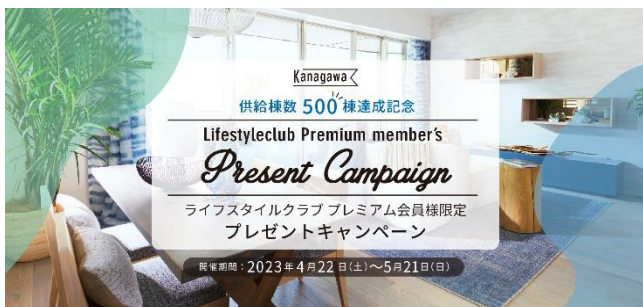
ライフスタイルクラブ プレミアム会員様限定プレゼントキャンペーン

現在、神奈川県 500 棟達成を記念して「明和地所グループ ライフスタイルクラブ プレミアム会員様限定プレゼントキャンペーン」と全国のクリオ ライフスタイルサロンでは「新規ご来場キャンペーン」の二つのキャンペーンを実施しています。キャンペーンの詳細につきましては、下記特設ページをご覧ください。