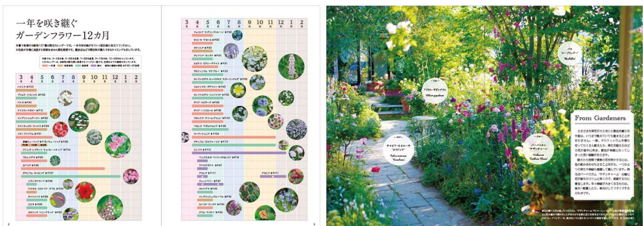
【書籍内のページ例1】