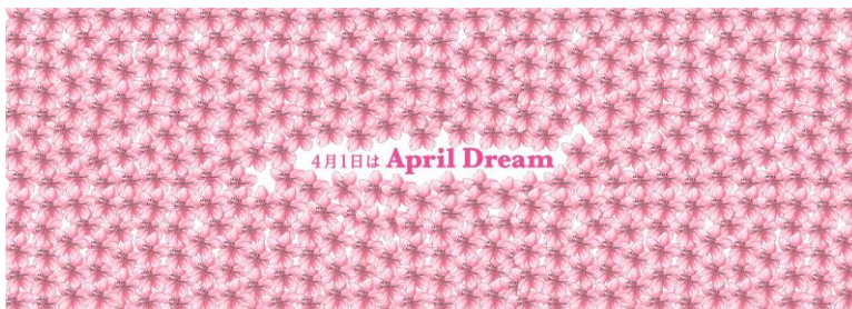
府庁内・市役所内に展示予定のクリエイティブイメージ

大阪府では2025年大阪万博を開催、世界中からまさに“夢のような”技術が集結します。できないと思っていたことが実現するかもしれないというワクワクがあふれています。そんな万博を控える府民はどんな夢を抱いているのか、どんな夢を実現したいと思っているのか、大阪万博とともに叶えたい夢を募集します。集まった夢は、大阪駅や夢の島で「夢が咲く、桜の花」として展示される他、大阪府庁や大阪市役所内で実際に集まった夢の展示も検討しています。今年の2月1日より募集開始した April Dream において [お住まいの地域、夢を叶えたい場所] を大阪府としてエントリーいただいた方の夢も、大阪駅に加えて府庁及び市役所内のスペースで展示いたします。