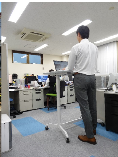
昇降式デスクでの仕事風景