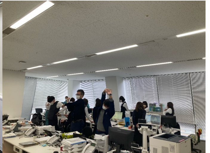
「3時のストレッチ」 風景