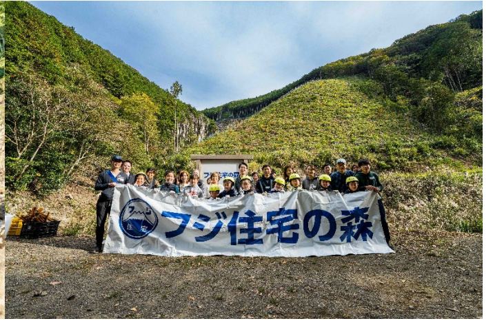
和歌山県日高川町『フジ住宅の森』 ハイキングと植樹活動