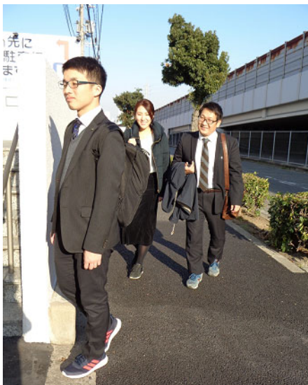
「スニーカー通勤」風景