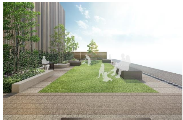
プレイロット完成予想図

※掲載の完成予想図は図面を基に描き起こしたもので建物の形状、仕様、色調、外構、植栽等は行政官庁の指導、施工上の都合及び改良のため一部変更が生じる場合があります。敷地周辺の建物・電柱・標識等は一部省略しています。植栽は特定の季節の状況を表現したのではなく、竣工時には完成予想図程度には成長していません。※植栽は計画段階のもので変更になる場合がございます。また、植栽の成長は環境により異なる場合があります。