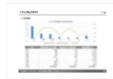
日系自動車メーカー8社のサプライチェーンに関する動向調査