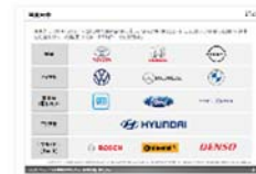
カーボンニュートラルに対するOEMとTier1動向調査