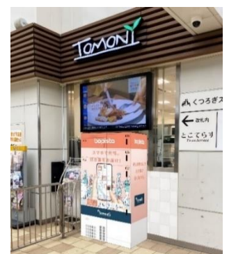
西武線所沢駅 中央改札 改札外 トモズ横処方薬専用ロッカー https://bopista.com/pages/loc

西武グループでは、コロナショックを乗り越え、ウィズ/アフターコロナの社会でお客さまに良質なトータルサービスを提供すべく、新たな事業創造の一環として、外部パートナーと連携しながら、西武グループが有するリアルな顧客接点とデジタルサービスを融合させたOMO（Online Merges with Offline）サービスの展開を積極的に検討してまいります。