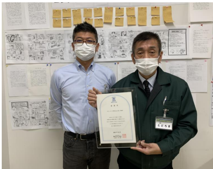
当社代表取締役社長岩崎（左）と 代表店舗として所沢山口店店長（右）