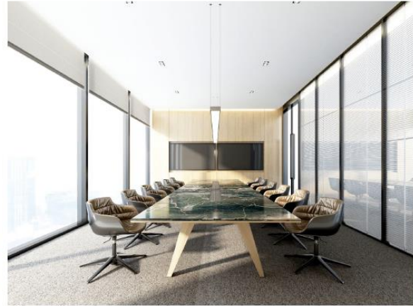
貸リモート会議室