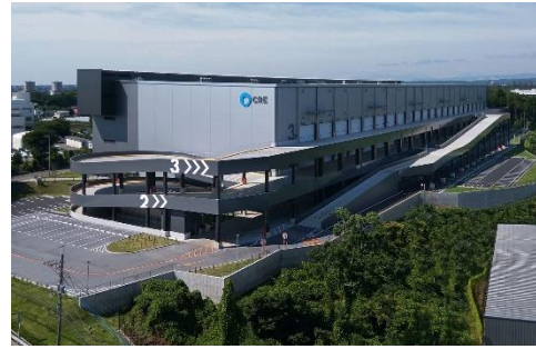
18 ロジスクエア狭山日高 2020年6月竣工