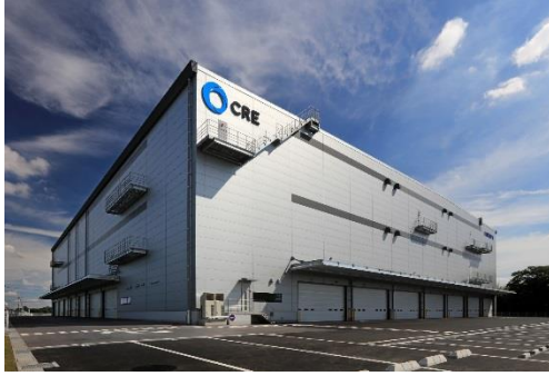
13 ロジスクエア春日部 2018年6月竣工