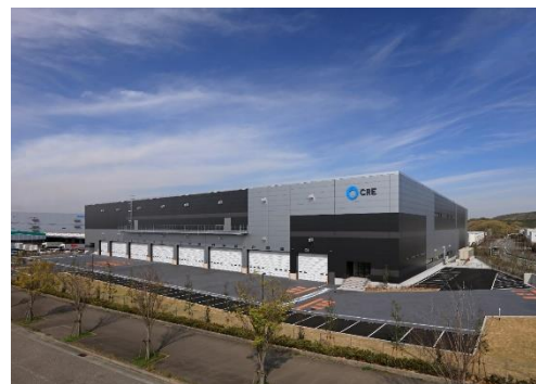
16 ロジスクエア神戸西 2020年4月竣工