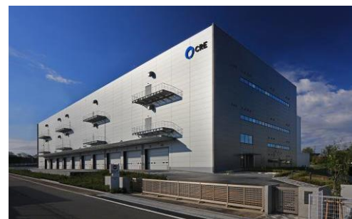
8 ロジスクエア新座 2017年4月竣工