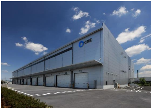
15 ロジスクエア川越Ⅱ 2019年6月竣工