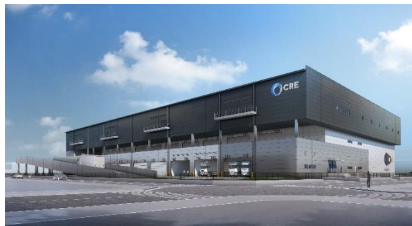
22 ロジスクエア白井 2022年12月竣工予定