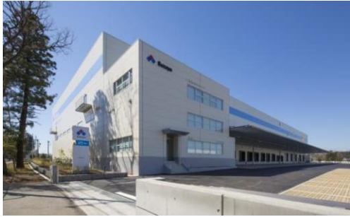
3 ロジスクエア日高 2015年3月竣工