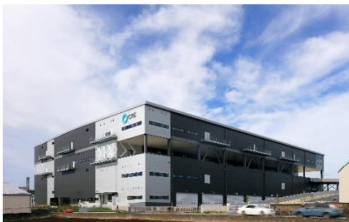
17 ロジスクエア三芳 2020年6月竣工