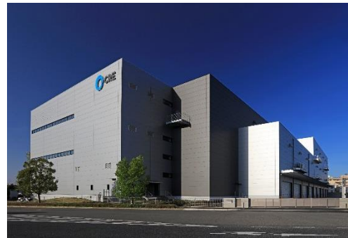
14 ロジスクエア上尾 2019年4月竣工