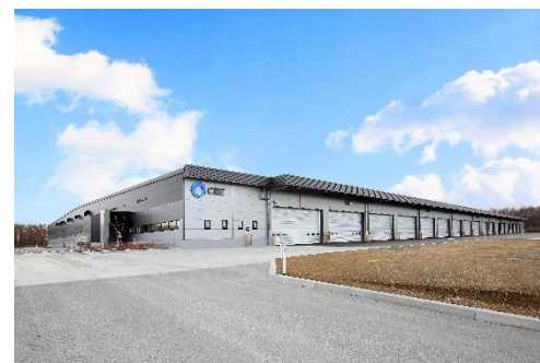
10 ロジスクエア千歳 2017年12月竣工