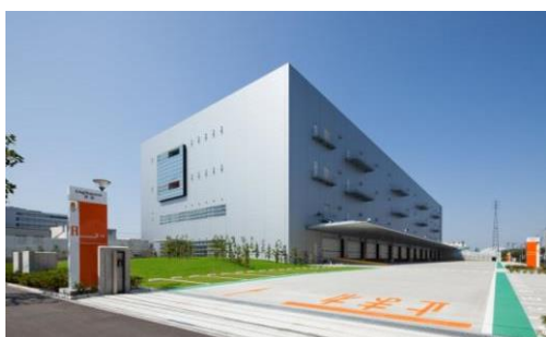
1 ロジスクエア草加 2013年6月竣工