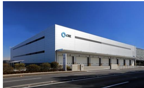
6 ロジスクエア久喜II 2017年2月竣工