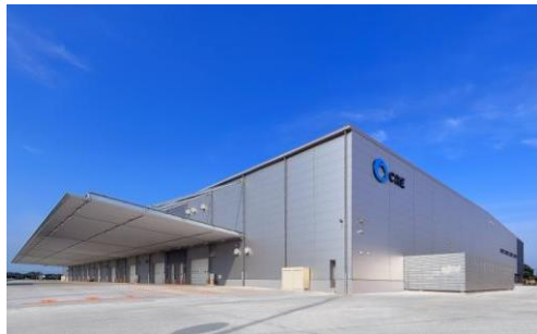
5 ロジスクエア羽生 2016年7月竣工