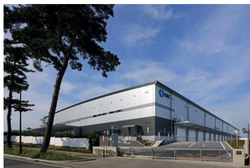
9 ロジスクエア守谷 2017年5月竣工