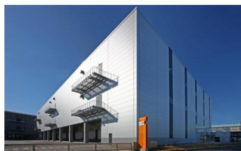
2 ロジスクエア八潮 2014年1月竣工