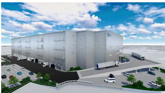
23 ロジスクエア枚方 2023年1月竣工予定