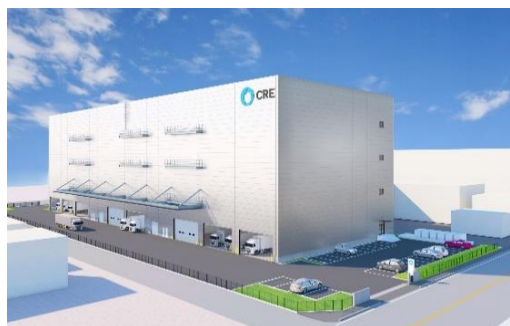
25 ロジスクエア松戸 2023年春頃竣工予定