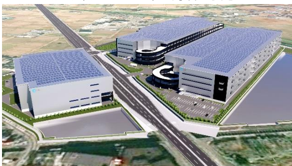
28-30 ロジスクエアふじみ野 (A棟・B棟・C棟) 2023年、2024年竣工予定