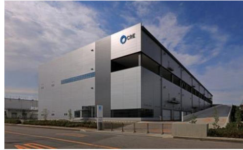
4 ロジスクエア久喜 2016年6月竣工