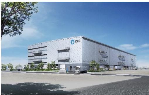
21 ロジスクエア伊丹 2022年11月竣工予定