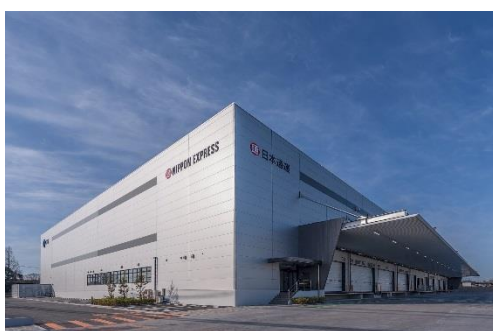
11 ロジスクエア鳥栖 2018年2月竣工