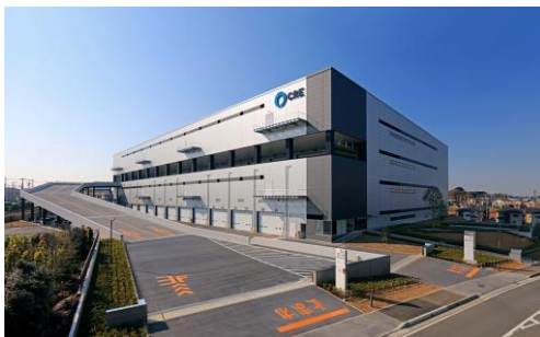
7 ロジスクエア浦和美園 2017年4月竣工