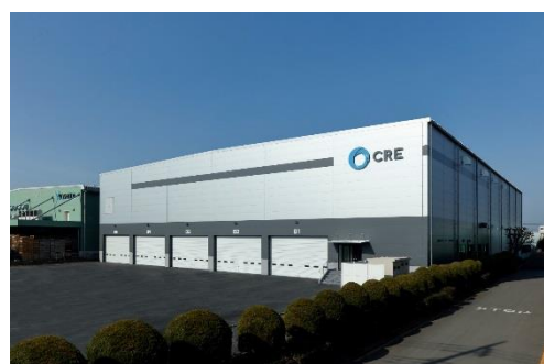
12 ロジスクエア川越 2018年2月竣工