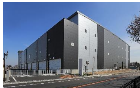
20 ロジスクエア三芳Ⅱ 2021年3月竣工