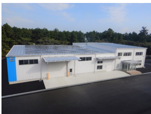
荇原実業パワー株式会社全景

雨天が続き電源不足時でも一日分の電源が確保されます。更に空調機の運転をセーブすることで最大5日間程の照明、コンセントなどの電源は確保されます。