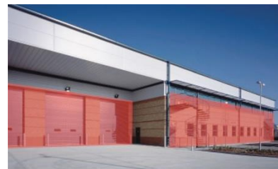
壁面警備 大型倉庫、配送センター