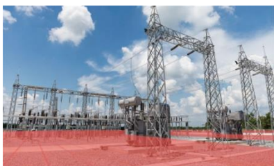
重要施設 変電所、エネルギー関連施設