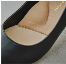
Point 2 つま先クッション