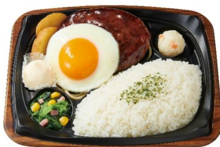
てりたまグリルハンバーグプレート 650円

ソースかつと目玉焼きや、マヨネーズの組み合わせは、ごはんが進みます。 グリーンリーフと赤・黄ピーマンのサラダも一緒にお召上がりください。