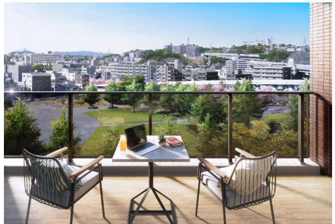
借景バルコニー完成予想図 D1タイプ（※3）