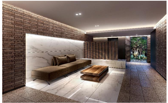
エントランスホール完成予想図（※15）