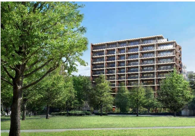
借景外観完成予想図（※2）

住戸プランは1LDK～3LDK、38.22㎡～73.63㎡とし、バルコニー側のリビング・ダイニング、洋室は柱型が室内に出ないアウトフレームを採用し、下がり天井が出ないように工夫するなど、収納力と機能性を重視した快適な室内空間を追求しています。