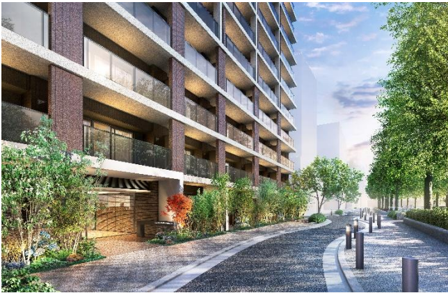
借景外観完成予想図（※14）