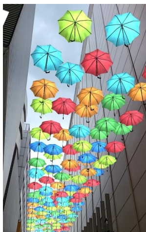
アート & 空間らくがき