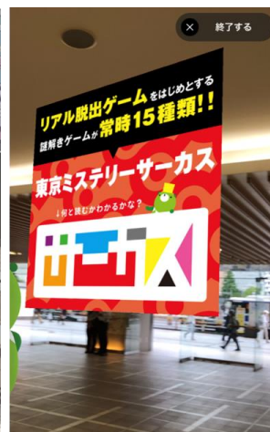
広告・クーポン配信