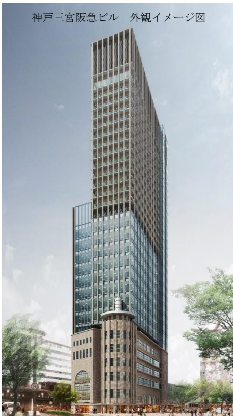
神戸三宮阪急ビル 外観イメージ図