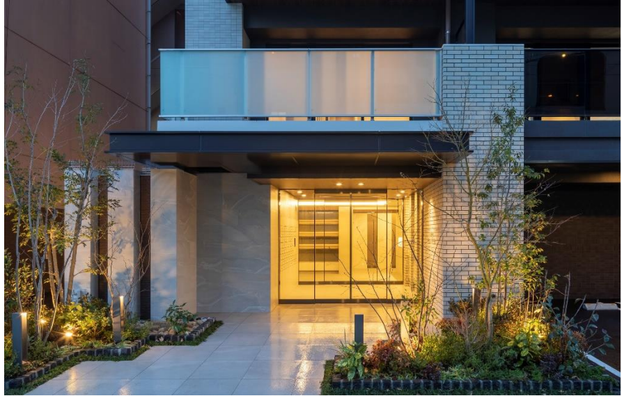
エントランスアプローチ完成写真（※3）