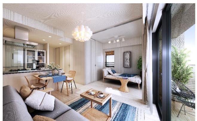
リビング・ダイニング完成予想図 D タイプ (※8)