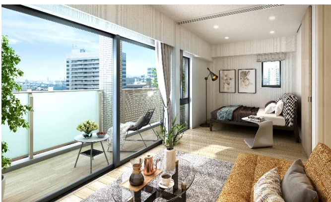
リビング・ダイニング完成予想図 A タイプ (※7)

住戸は全て 1LDK とし、各住戸にウォークインクローゼットを確保するなど、豊かな収納スペースを備えることで居心地のいい空間を提案しています。