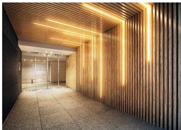
左：外観完成予想図 右上：エントランスアプローチ完成予想図 右下：エントランス完成予想図 (※3)