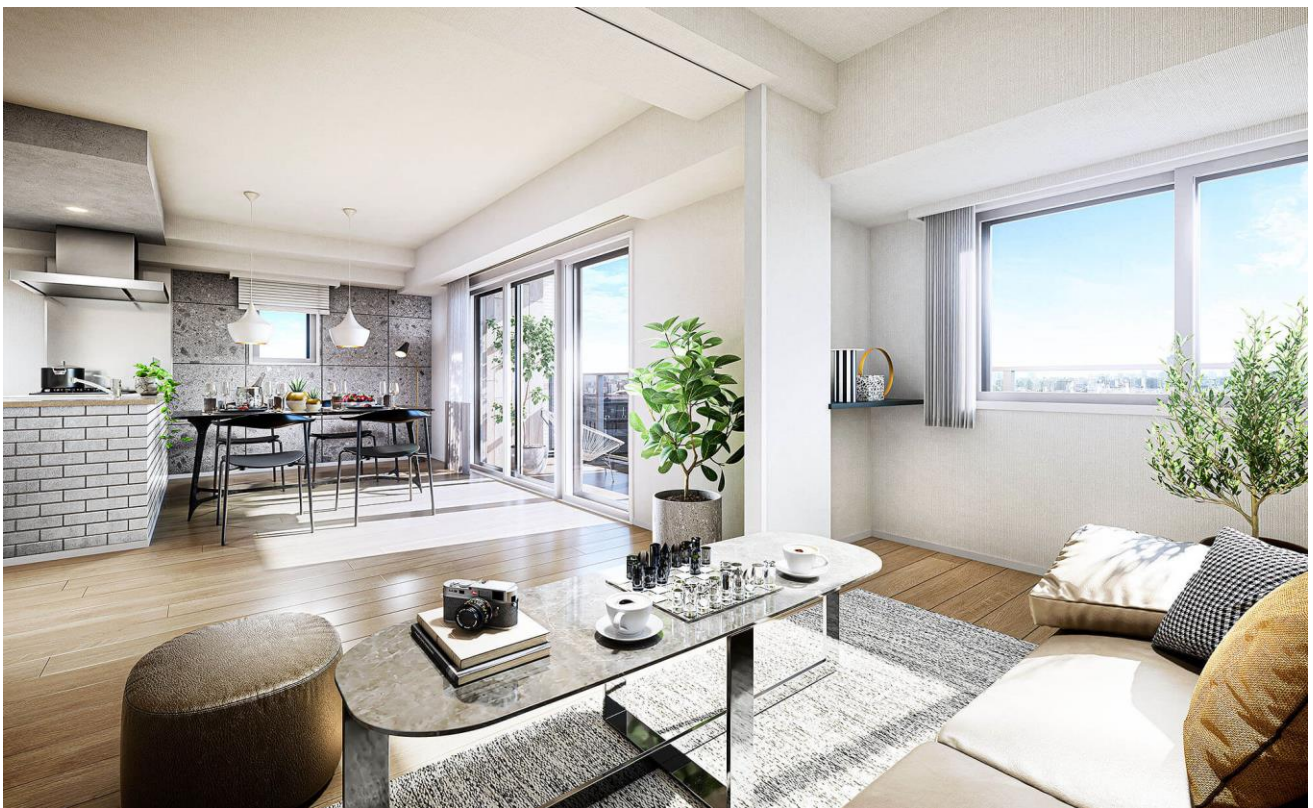
リビング・ダイニング・キッチン完成予想図 (B タイプ) (※10)