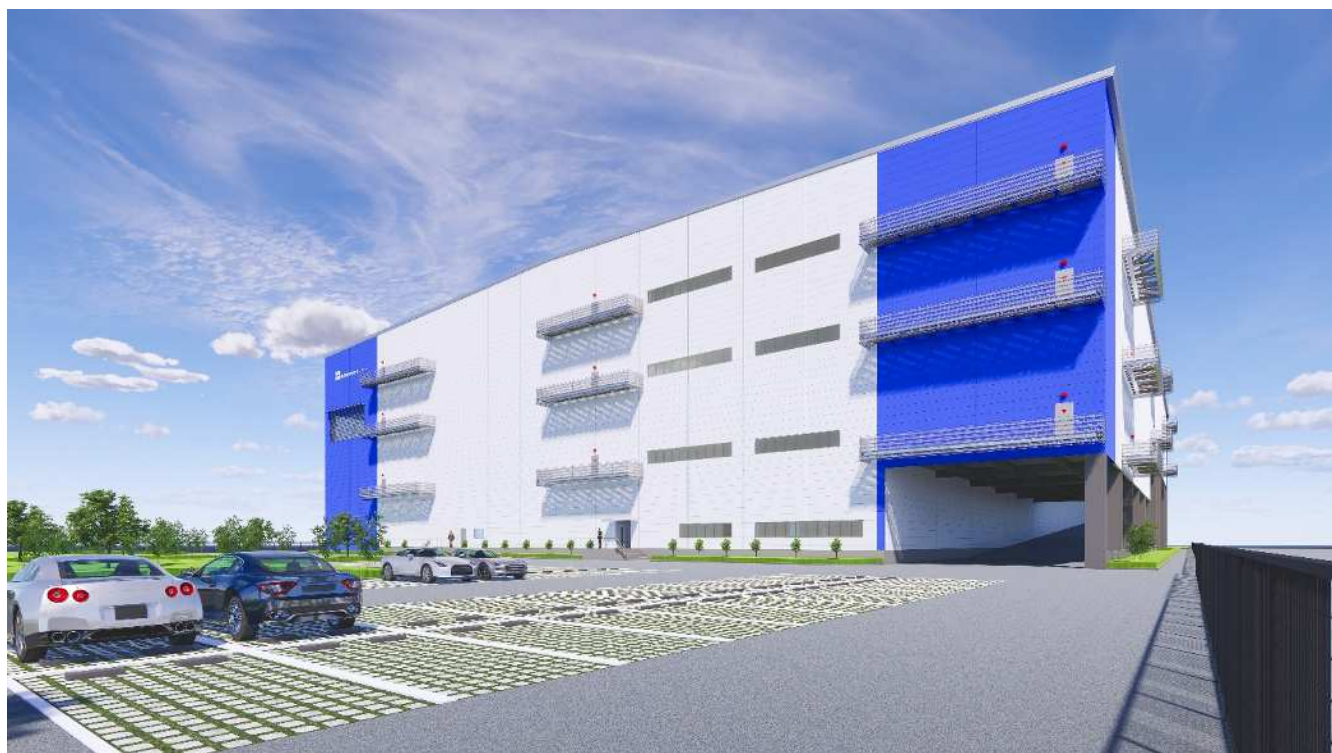
※ 「(仮称) 高槻市マルチテナント型物流施設」

神鋼不動産と東京センチュリーは、再生可能エネルギーの普及・拡大を推進することにより、脱炭素社会の実現を通じた社会課題の解決に貢献してまいります。