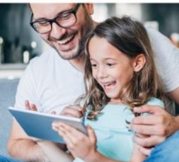
多彩なエンターテインメント