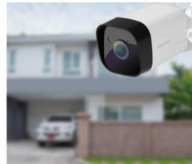
各方面にカメラ設置で セキュリティ万全

※スマート DO ホームはインターネット回線を経由してのサービスとなります。ご利用にはインターネット回線契約（契約先は自由）が必要となります。また、IoT 機器のコントロールにはスマートフォンやタブレットが必要となります。掲載のスマートフォン画面やその他の写真はイメージです。