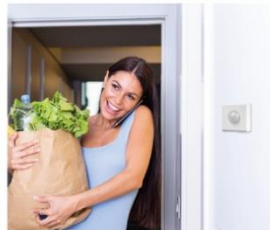
人感センサーでエアコンやテレビの ON/OFFも可能