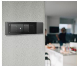
タッチディスプレイで スマートホーム機器を集中管理