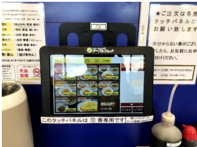
<店内備付けタッチパネル「テーブルショット」からご注文>

また、来来亭は、お客様に大人気の全国的ラーメンチェーンですので、店内店外でお待ちいただくお客様に対して、お席につかないお待ちの状態から注文ができるように「お待ちオーダーシステム」を一部店舗で導入されております。このようなオーダーシステムのカスタマイズも可能です。