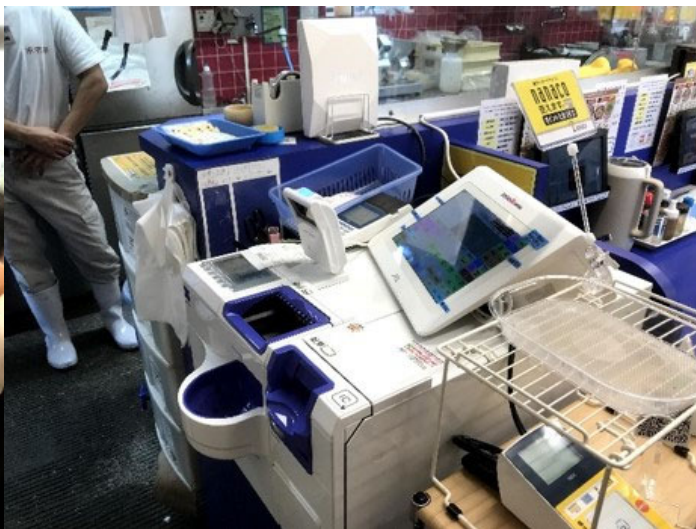
<セルフレジ「セルフショット」設置の様子>