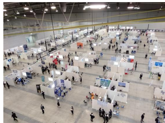
＜「北九州合同採用説明会」のオンライン会場・リアル会場イメージ＞

北九州市では、地元会場で毎年リアル開催していた「北九州合同採用説明会」が、2020年は新型コロナウイルスの影響によって全面オンライン開催となったことを契機に、地元企業と学生の接点を増やしていくため、オンラインも積極活用する方針を決められました。リアル対面での接点も重視されていますが、UIターン就職の推進も視野に、「イベント当日は、現地に行くことが難しい」「中座しなければならない」という学生が情報収集の機会を損なわないよう、オンラインでの参加環境を整えたハイブリッド形式とすることで、地元企業と学生の接点を増やしていこうと考えられています。