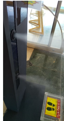
*噴霧除菌ロボット：アタッチメントを変えて天井近くまで