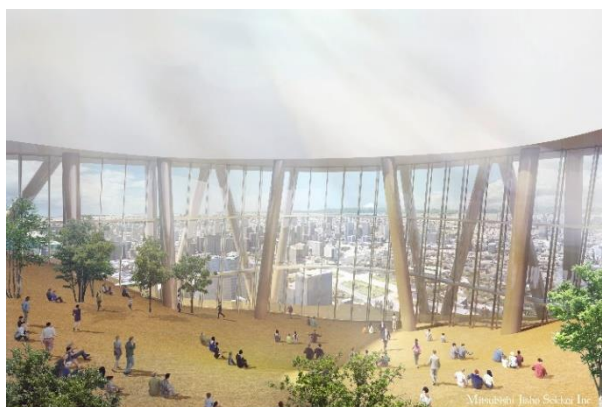
▲5F ホテルロビーイメージ