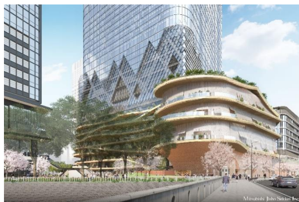
▲3F-6F 大規模ホール外観イメージ