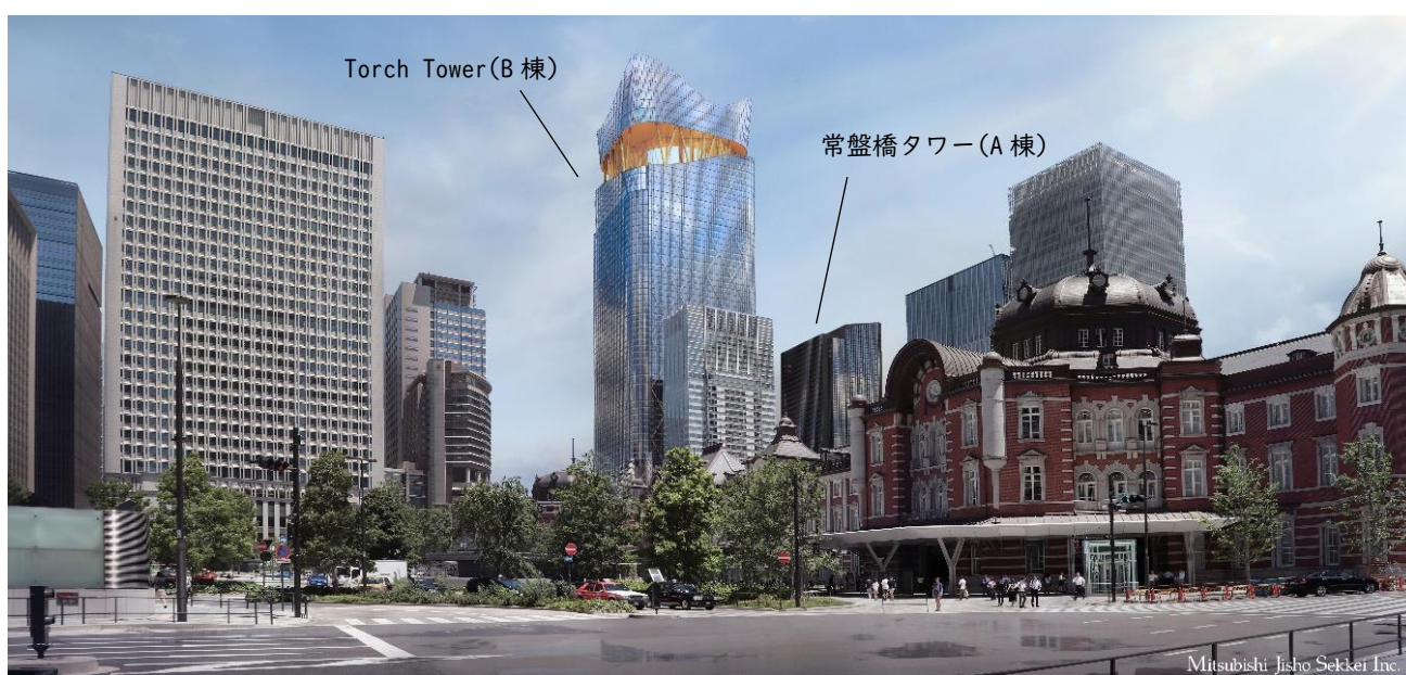
▲TOKYO TORCH 全体開業時外観イメージ／東京駅丸の内側より