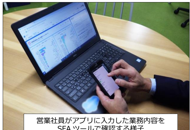
営業社員がアプリに入力した業務内容をSFAツールで確認する様子

しかしながら、営業工数データの収集・分析を通じたさらなる業務効率化、営業社員の入力工数の削減、帰社後の報告ではリアルタイムな情報共有が難しい、という課題を抱えていました。