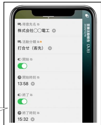
ワンタップで業務時間・状況をアプリから報告

また、この「営業活動報告アプリ」の導入により、営業活動の報告作業が場所を問わずにワンタップで行えるようになり報告時間の短縮を実現。営業社員は活動状況をリアルタイムで報告し、管理者が把握できるようになりました。また、営業活動工数の可視化により、工数のかかる業務の見直しをすることで、業務効率の改善を実現しました。