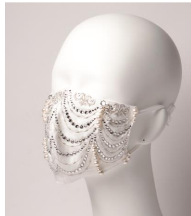
↑デザイン3：シルバーカラー