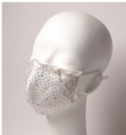
↑デザイン1：オーロラカラー