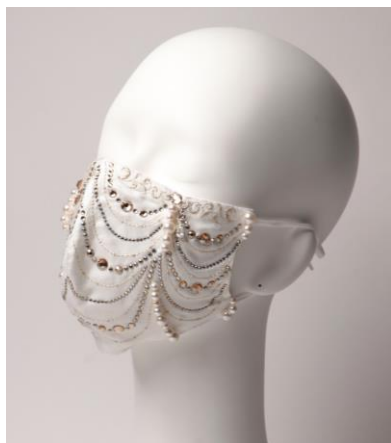
↑デザイン2：ゴールドカラー