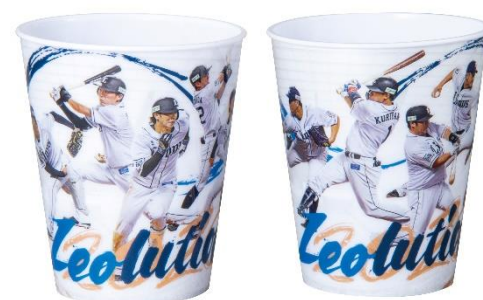
Leolution リユースカップ(全6種)