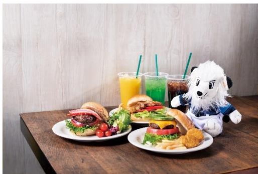
各種ハンバーガー