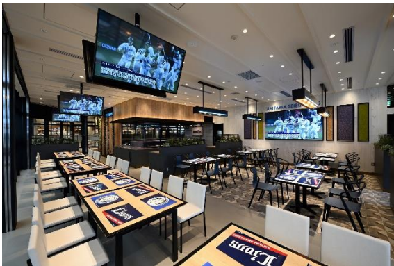
LIONS DINER BIGFLAG 店内