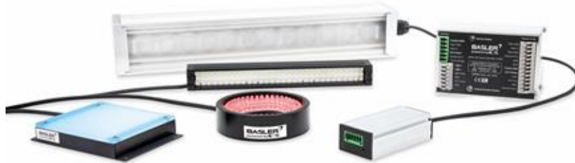
Basler Camera Light（一例）とコントローラー

本製品は、国内 13 拠点にあるテストルーム（実験室）で、ライティングコンサルタントにご相談いただきながらお試しいただくことが可能です。シーシーエスは、お客様の「見える！」を実現するため、画像処理システムや周辺デバイスとのシームレスな接続性を実現する製品を、他社とのアライアンスも取り入れながら開発を進めてまいります。