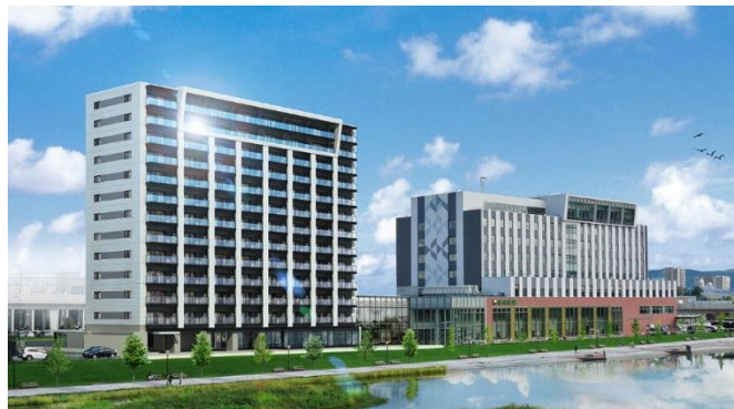
「デュオサンテ旭川北彩都」完成予想パース（写真左）

所在地：北海道旭川市宮前二条一丁目2番6 交通：JR 函館本線・宗谷本線・富良野線 「旭川」駅徒歩3分 構造・規模：鉄筋コンクリート造一部鉄骨造 地上13階建 総戸数：住戸96戸 竣工：2022年2月下旬（予定） 入居：2022年3月下旬（予定）