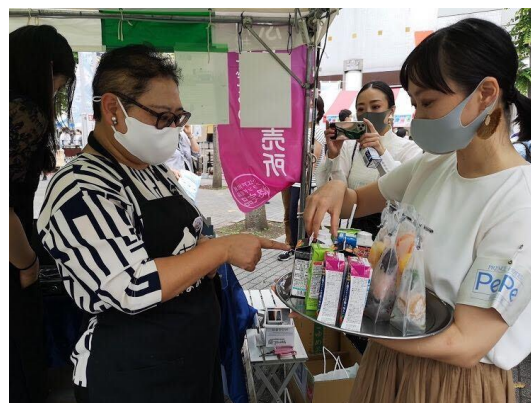
西武本川越ペペ ファーマーズマーケットでの試飲の様子

また、本プロジェクトを紹介する Web サイトを本日オープンし、今後取り組んでいく循環型社会の形成に向けたプロジェクトについて紹介してまいります。URL： http://loss-value.com/