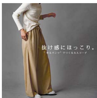
レディースアパレル