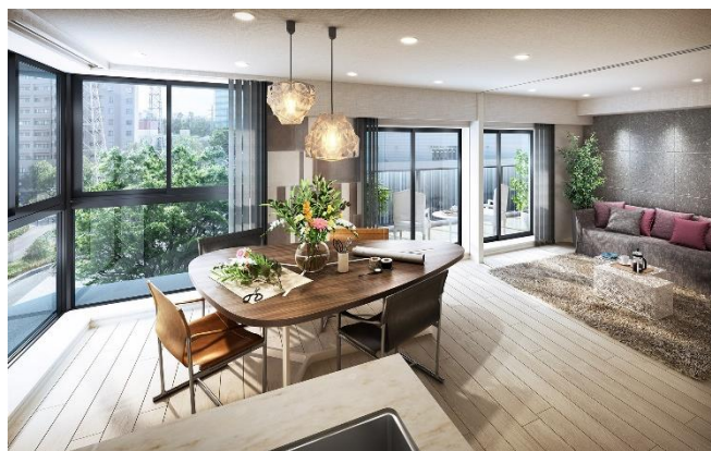
リビング・ダイニング完成予想図・C3タイプ (※8)