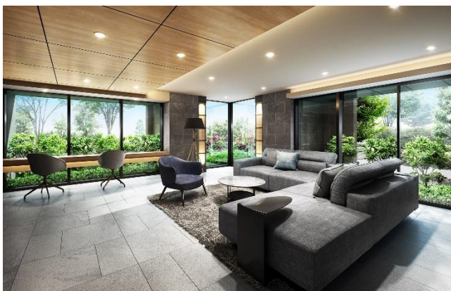
エントランスホール完成予想図 (※4)