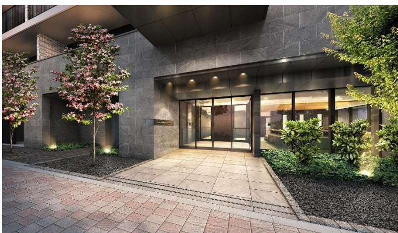
エントランスアプローチ完成予想図（※4）