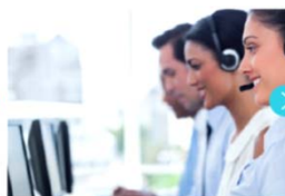
3. 通訳オペレーターに接続