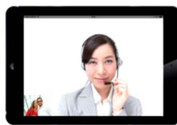
4. 映像を見ながら通訳開始