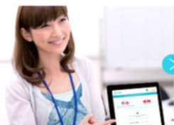
2. 店頭スタッフが言語を選択