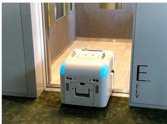
エレベーターに乗り込む CL02

※ SLAM (Simultaneous Localization and Mapping) : 自己位置推定と環境地図作成を同時に行うこと