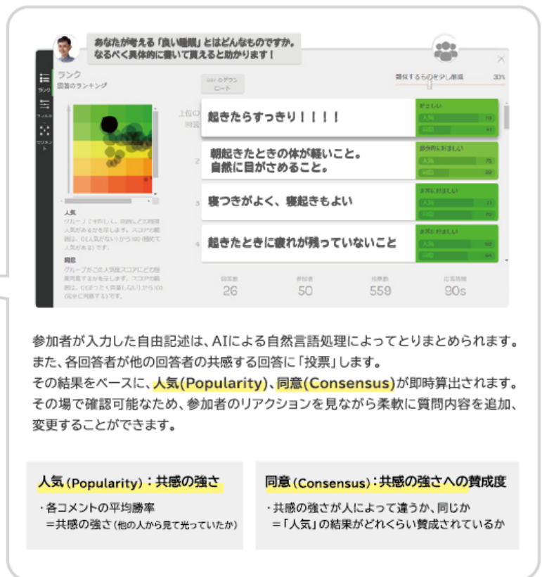
アウトプットのイメージ