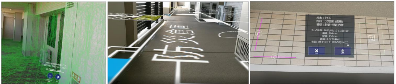
[左：3D モデルを作成する際のイメージ