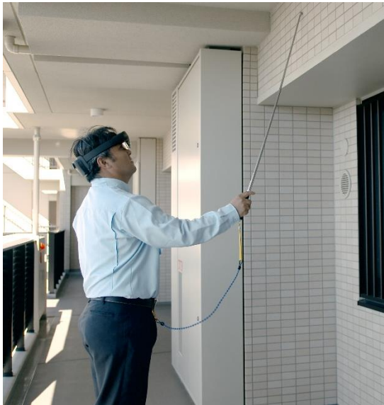
HoloLens 2 を付けた打診検査の様子