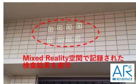
上：検査記録項目選択画面、下：タイル浮き入力例