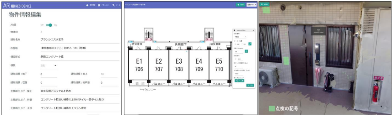
[左：物件の登録画面