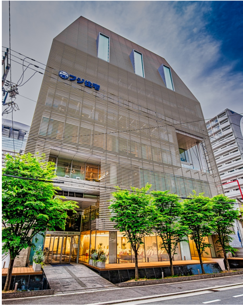
【大阪支社ビル新社屋 外観】