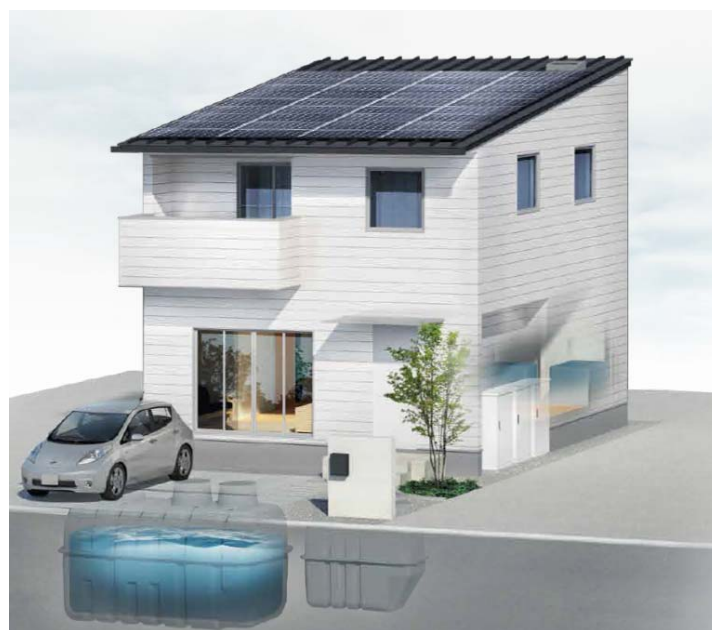
図1 OTSハウスイメージ

近年の日常生活を脅かす大規模自然災害の多発により、水や電気などのライフラインに対する意識が大きく変化する中、災害発生時も平常時と同じ生活が送れる「OTSハウス」はこれからの時代に適応した住宅と言えます。