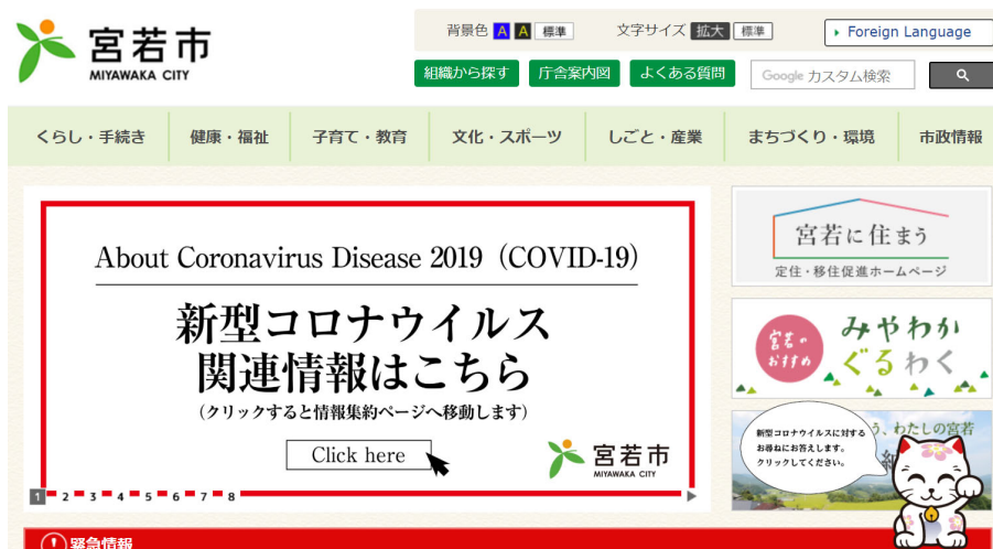
福岡県宮若市 公式ホームページ