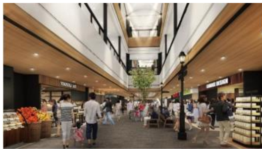
〒238-0041 神奈川県横須賀市本町2-1-12 Coaska Bayside Stores HP→ https://coaska.jp/