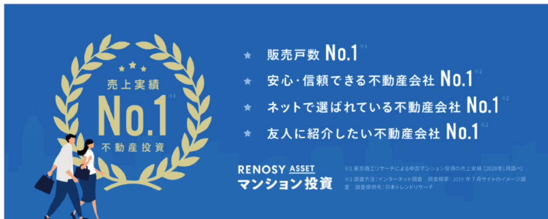
<RENOSY ASSET マンション投資、販売実績でNo.1を獲得>

当社はこれまで、安定した収益性が見込まれる大都市圏の中古マンションに特化した不動産投資サービスを提供してまいりました。特に、テクノロジーの活用による透明性が高く手間の少ない不動産取引や、投資用マンションに特化したリノベーションサービスなど充実のアフターケアにより、不動産投資の不安とハードルを下げるサービスを提供してまいりました。これにより、顧客の約7割（67%、2020年1月時点）が20-30代と、働き盛りのビジネスパーソンに多くの支持を得て、販売数を順調に伸ばしております。