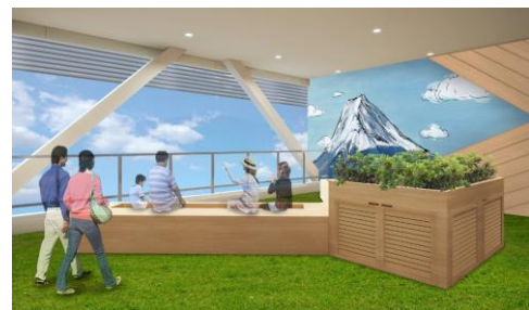
〈足湯サービスイメージ〉