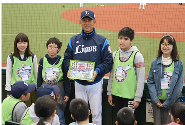
6月講座 メットライフドームでお仕事体験と施設見学 (写真は昨年度の様子です)

「西武塾」は、西武グループ各社の社員が、経営理念でもあり社員の行動指針でもあるグループビジョンに基づいて、アイデアを経営層に提言する施策「ほほえみFactory」から生まれたものです。今後も西武グループでは、グループスローガン「でかける人を、ほほえむ人へ。」のもと、お子さまの健やかな成長を応援してまいります。