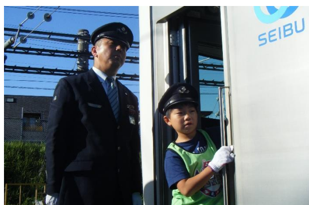
12月講座 バスと鉄道のお仕事体験 (写真は昨年度の様子です)