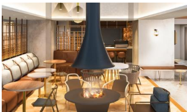
1階のカフェラウンジ「T&Cafe」(完成イメージ)