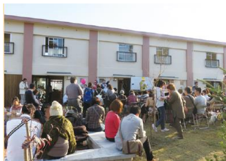
●ひばりが丘パークヒルズ/東京都西東京市 ●運営:一般社団法人まちにわ ひばりが丘

コミュニティスペース、カフェ、共同菜園や芝生広場、カーシェアを備えるコミュニティセンター。