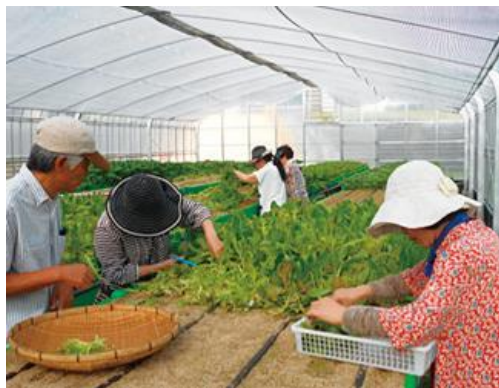
●日の里/福岡県宗像市 ●運営:東レ建設株式会社等

地域住民が協力して野菜を栽培し、朝市などのイベントを行う外、収穫した野菜を学校給食に提供するビニールハウス型農場。