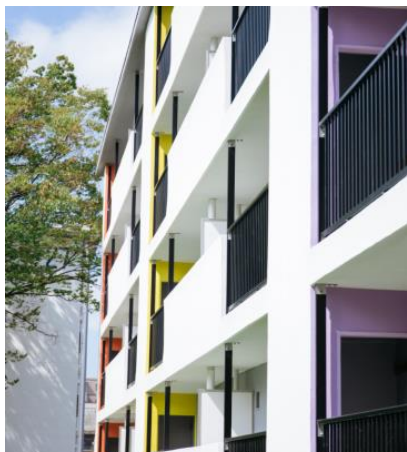
写真1 全面的に外壁を刷新

(株)フージャースアセットマネジメントは内装デザイン、外構整備を実施し、入居開始後は、賃貸住宅としての管理・経営を行っていきます。