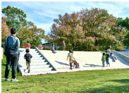
リニューアル後の公園～緑化により生まれ変わる～