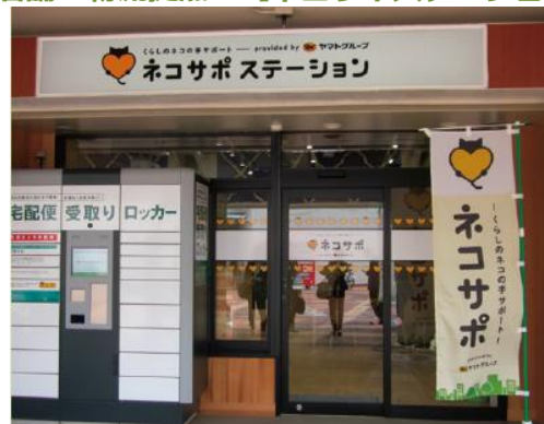
●多摩ニュータウン永山/東京都多摩市 ●運営:ヤマト運輸株式会社

コミュニティ活動・一括配送・家事・買い物代行サービス等の生活支援機能を付加した物流拠点。