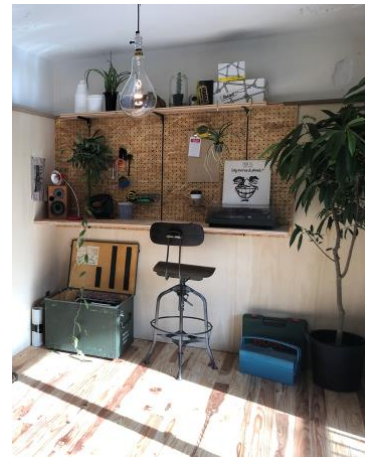
写真2・3 DIY・アウトドアをコンセプトとした住戸リノベーション