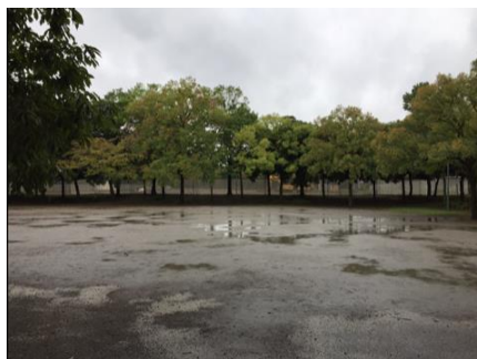
リニューアル前の公園

本プロジェクトの他に、不動産開発事業を担う(株)フージャースコーポレーションが、つくば市との連携による、「公園の再生」に取り組んでいます。（「竹園西広場公園」再生プロジェクト）