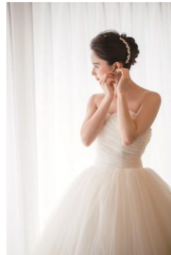
ブライズルームイメージ

花嫁専用の快適なブライズルームでの身支度。 待ちわびた一日を迎える高揚感を味わいながら、 ゆっくりと花嫁姿に仕上がっていくその一瞬一瞬を リラックスしてお過ごしいただけるように