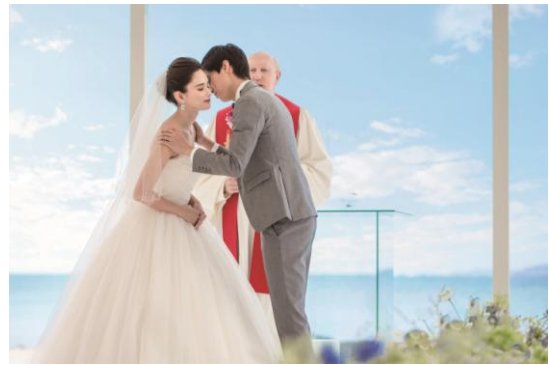
セレモニーイメージ／完成予想図