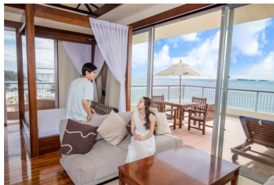
カヌチャリゾートイメージ