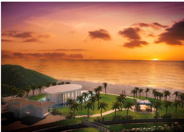
ガーデンイメージ/完成予想図

まだ手付かずの自然が多く残る名護の地に広大なエリアを有するカヌチャリゾート。 雄大な自然をそのまま活かしながら、やんばるの森と海に寄り添うようにして広がり、 求めるすべて理想を超えて目の前に差し出される楽園。