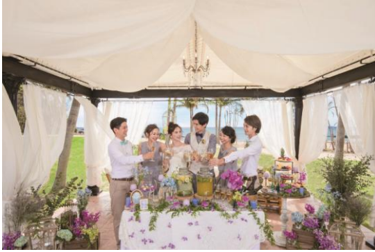
ウェルカムレセプションイメージ