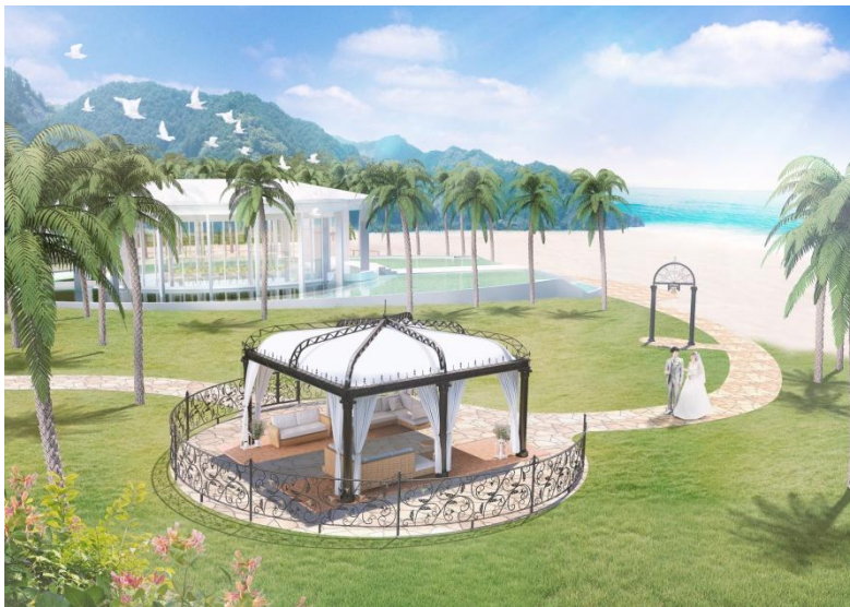
ガーデンイメージ／完成予想図