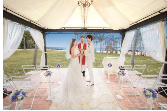
ガーデンウエディングイメージ