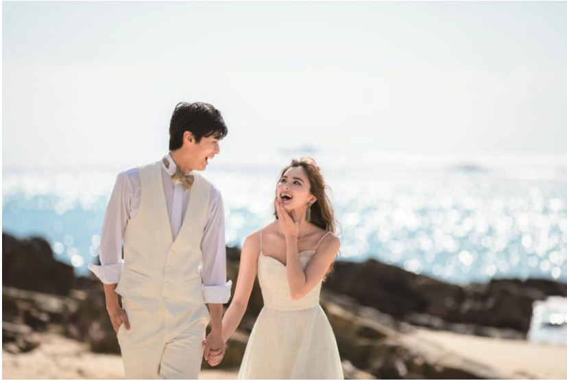
ビーチフォトイメージ